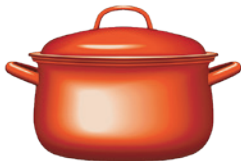
Grand chaudron (avec couvercle)