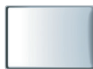
Plaque à pâtisserie