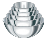
Ensemble de bols à mélanger