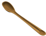
Cuillère de bois