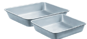
Moules à cuisson (carré de 20 cm et rectangulaire)

Équipement idéal selon les recettes proposées par la Fondation OLO