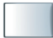
Plaque à pâtisserie