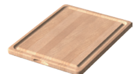
Planche à découper